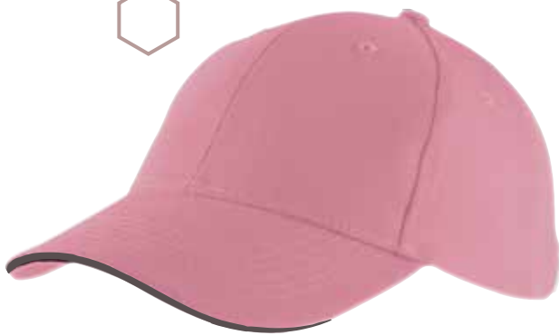
ROSE / ANTHRACITE

Sergé brossé Visière préformée Tranche de la visière en liseret de couleur contrastée Ajustement arrière par boucle métallique argent + passant 260 g/m 2